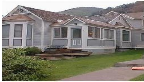
کوه، سنگ، ساختمان، چمن، ابر، پنجره