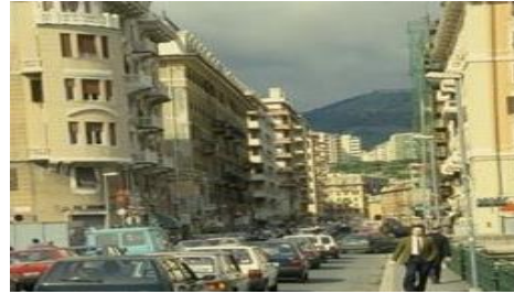
ساختمان، سنگ، ماشین، کوه، جاده، ابر